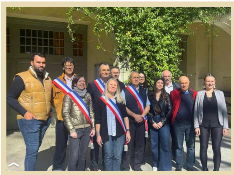
Les douze élus présents lors de cette séance inaugurale.